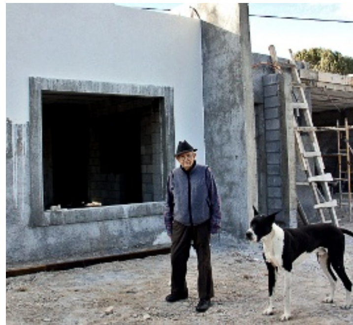
➤ Don Lorenzo usó su subcuenta, más un préstamo del Infonavit, para hacer su casa de 116 metros cuadrados al poniente de Saltillo.

El crédito se otorgó en octubre de 2010, y unas semanas después comenzó la construcción de la casa que actualmente registra un 80 por ciento de avance.